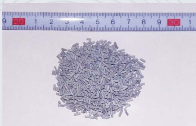
Катализатор конверсии ПГ КФИ-10