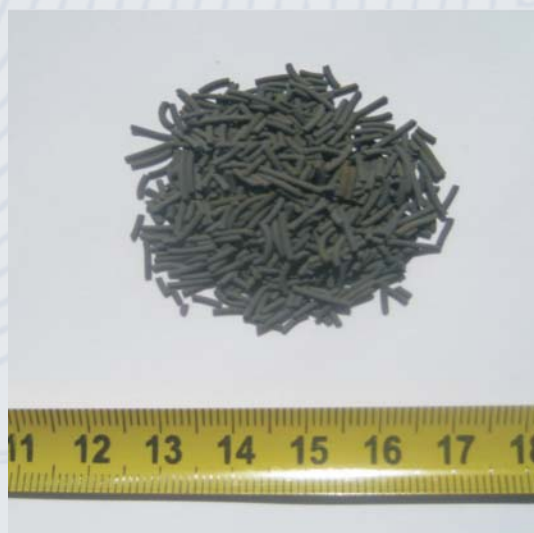
Катализатор синтеза жидких углеводородов