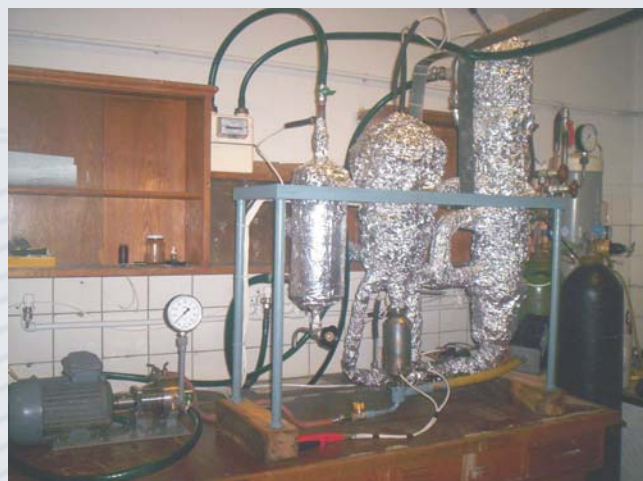
Пилотная установка получения синтез-газа конверсией ПГ под давлением 1,0 МПа

Снять проблемы со странами, через территории которых проходят магистральные газопроводы и т.д.